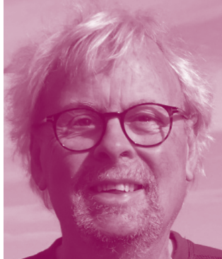
TABLE RONDE / Espérer pour agir ensemble